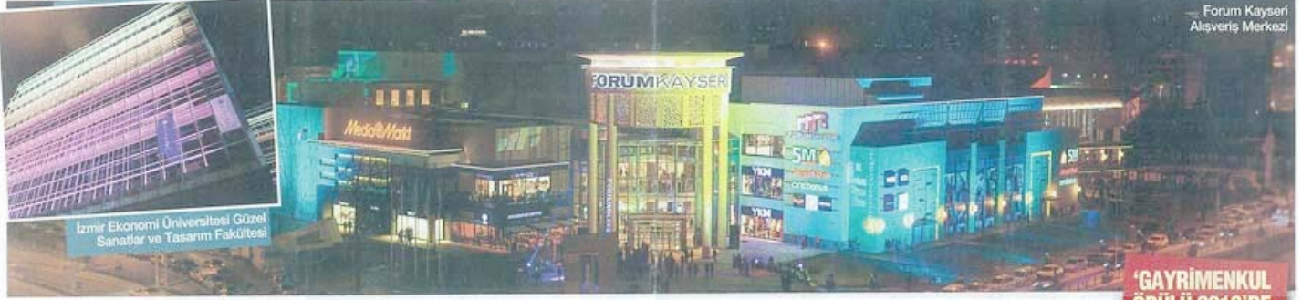
Forum Kayseri Alışveriş Merkezi