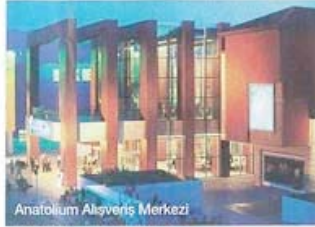
Anatolium Alışveriş Merkezi