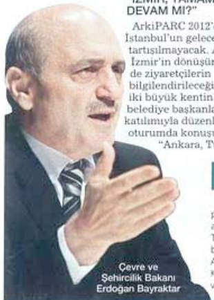
Çevre ve Şehircilik Bakanı Erdoğan Bayraktar